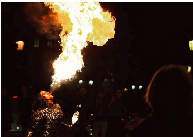
KEYLA BRASIL PUSSY IN FLAMES