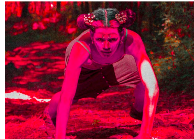
LAVA MAGMA DE PODER

4 NOV, 6ª FEIRA - 20H Foyer RUA DAS GAIVOTAS 6